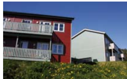
MUB Hjellmyra: 24 leiligheter.