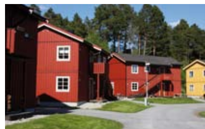
MUB Høgnakken: 14 leiligheter.