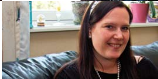
Yngste styreleder Side 8