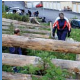
Dugnad i Øvre bydel Side 29