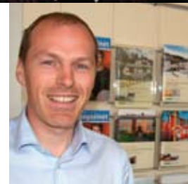
Godt salg hos Garanti Side 36