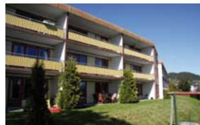
MUB Fuglset: 24 leiligheter.