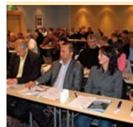
MOBO øker medlemskontigenten Side 29