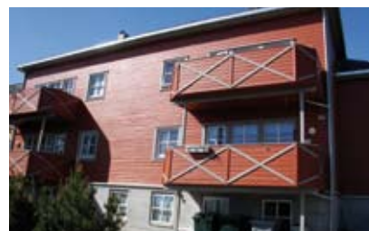
MUB Minde: 5 leiligheter.