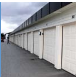
Nye garasjeporter s. 12

MediaPartner, Bekkevollvegen 18, 6414 Molde Tlf. 71 20 61 00 Fax 71 20 61 01