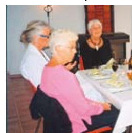
40-årsfest i Granlia III s. 12