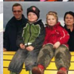
MoBarn runder 20 år s. 8-10