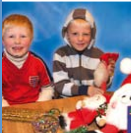
Førjulso i Nordbyen s. 30