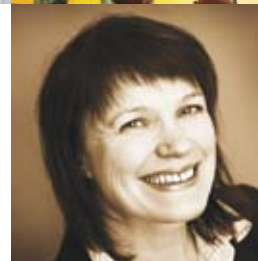
Prisutviklingen på boliger s. 36