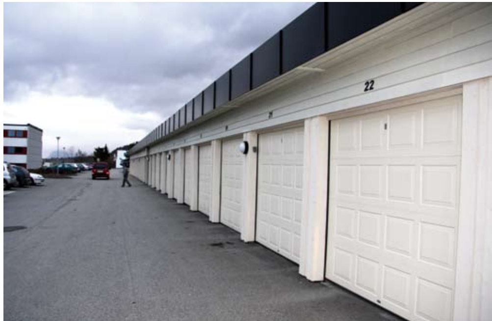
Berg Borettslags garasjeanlegg framstår som nytt etter at det ble rehabilitert malings- og portmessig etter 32 år.

nøyd med arbeidet som er gjort, både Dale Bruk som har levert garasjeportene og portåpnerne - og dugnadsinnsatsen fra